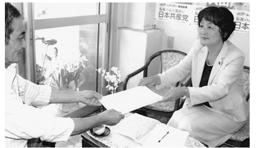
大山とも子都議会議員 (日本共産党)