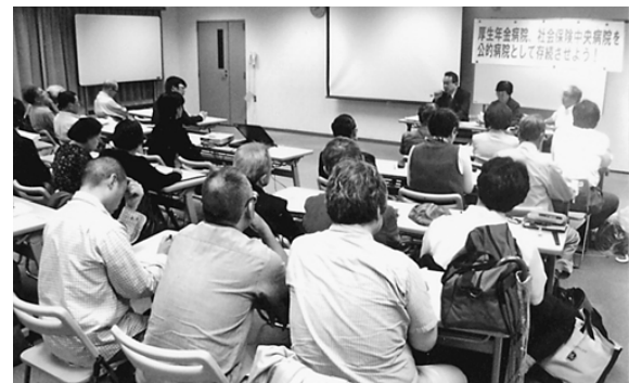
全国連絡センターの報告に確信を深める