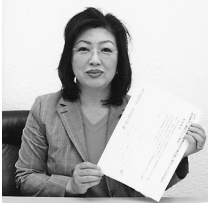
いのつめまさみ都議会議員 (民主党)