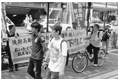
ひときわ目立つ横断幕かかげて

6月25日、新宿社保協は新宿区役所前で昼休み宣伝を行い、支部から12人、全体で18人が参加しました。