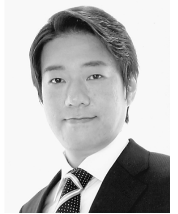
秋田一郎都議会議員 (自由民主党)