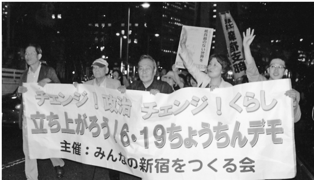
街ゆく人々に手を振って訴えるデモ隊

編集・発行人 東京土建一般労働組合新宿支部 新宿区北新宿4-33-9 新建ビル 電話03(3362)2161 FAX03(3362)2289 http://www.doken-shinjuku.jp/ E-mail: info@doken-shinjuku.jp 定価 1部 50円 (購読料は組合費を含む)