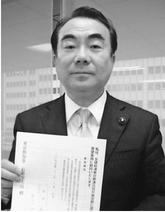
吉倉正美都議会議員 (公明党)