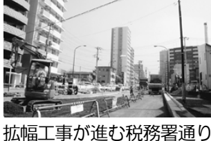
拡幅工事が進む税務署通り

東京の中心、新宿。その 柏木1丁目(現在の西新宿 8丁目)。終戦の2年前、 私は此で生まれました。 物心付いた時は、一面焼