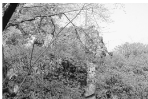
子供の頃登った富士塚