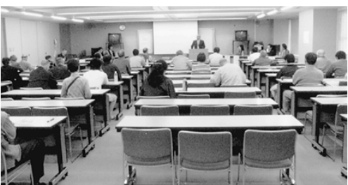
木造住宅の耐震技術セミナー (08.3.17)

多くの犠牲者を出した阪神淡路大震災から今年で13年が経過しました。あの災害を教訓とし、いつ発生してもおかしくない巨大地震から区民の生命と財産を守る「地震に強いまちづくり」を目的として「新宿区耐震補強推進協議会」(以下、協議会)が2月8日発足しました。