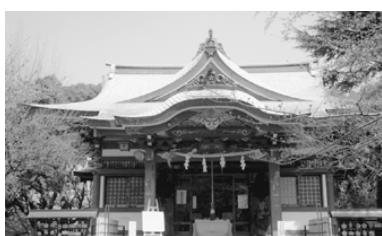
今も昔のままの成子天神社