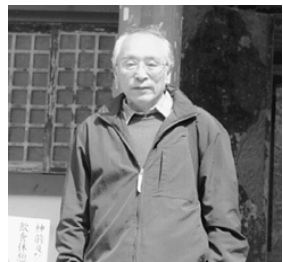
成子天神社に立つ

3〜4年先は、きつと高 層ビルが完成し、すっかり 変わるかと思いますが、私 の生まれ育ったふるさと柏 木は、いつまでも心に残っ ていることと思います。