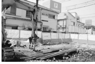
解体された自宅跡