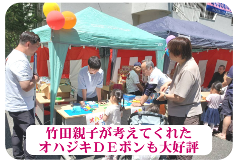
竹田親子が考えてくれたオハジキDEボンも大好評

きました。受け付けた62人の子どもたちも、それぞれシールを貼る子もいて、喜んで家に持って帰って行きました。これからの子どもたちが、この日本を変えて行く大切な人なのかもしれない。工作をしていた子どもたちは、みんな目がイ