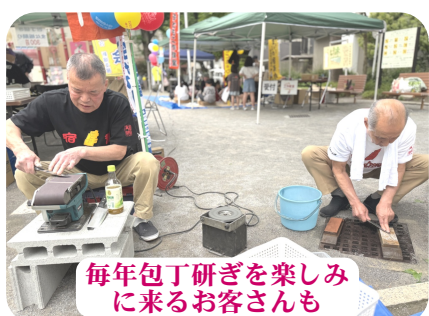
毎年包丁研ぎを楽しみに来るお客さんも