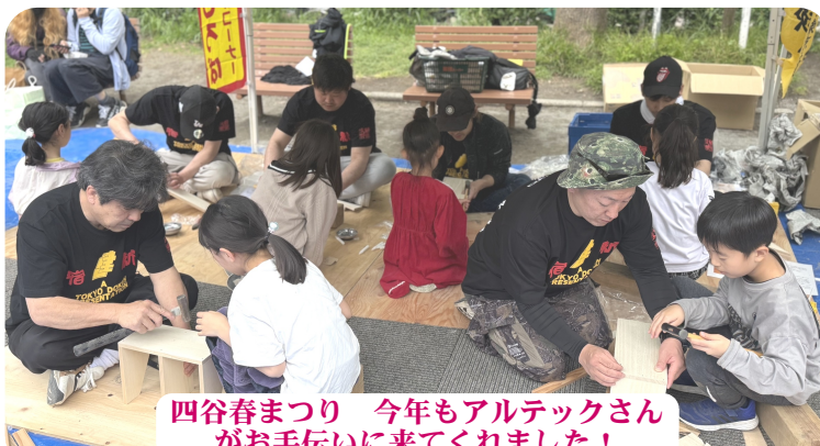
四谷春まつり 今年もアルテックさんがお手伝いに来てくれました!