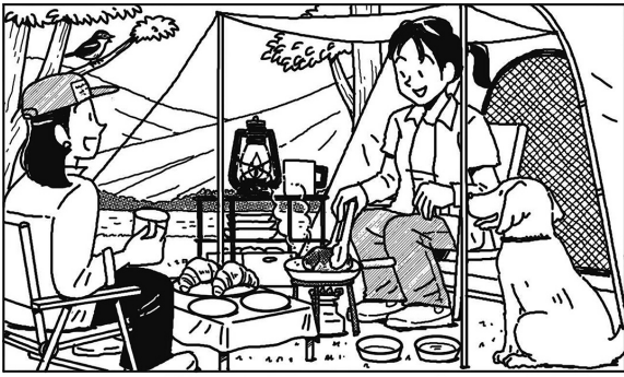
【問題】上の絵と下の絵では7つのマチガイがあります。どこでしょう？(作・広浜綾子)

「70才以上で組合員歴30年以上の組合費減額制度」と「75才以上の組合費減額制度」があります。