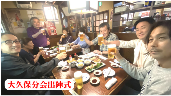
大久保分会出陣式