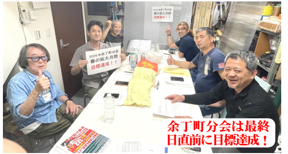
余丁町分会は最終 日直前に目標達成!