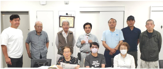
新都心分会出陣式