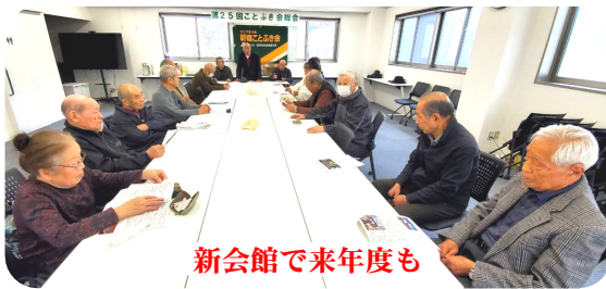
新会館で来年度も

●まちがい箇所を丸印で示し、支部まで送ってください。はがき・ファクス・メールで。分会・住所・氏名を(家族の方は組合員の氏名も)書いて下さい。余白には新聞の感想や身近なできごとを「必ず」添えてください。(未記載は抽選対象外) ●宛先: 〒169-0074 新宿区北新宿 4-33-9 東京土建新宿支部 ●正解者の中から10名に抽選で図書カードをプレゼント。 ●〆切: 4月24日(金)