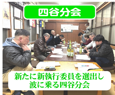
新たに新執行委員を選出し波に乗る四谷分会