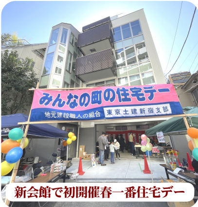
新会館で初開催春一番住宅デー

3月1日(日)、新落合西分会では、「とりあえずやってみよう精神」をキャッチフレーズに、何事にもまず挑戦してみようという気持ちで日々活動しています。今回の住宅デーの準備会議でも、何を出店するかみんなで頭を悩ませました。しかし、「まずはやってみよう」という思いで、最終的に8項目の出店を行うことになりました。