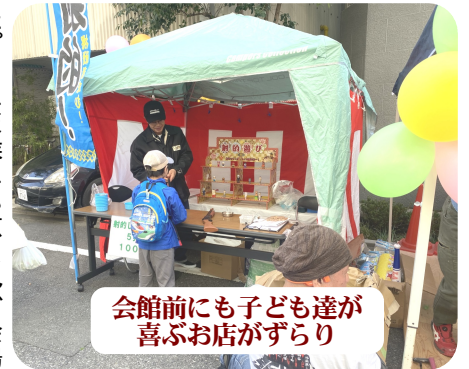
会館前にも子ども達が喜ぶお店がずらり

住宅デー当日は包丁65丁、工作32人、射的62回、ヨーヨー30個、コイン落とし50回、バターゴルフ43人、缶バッチ23個、チョコ飴類82個の結果となりました。当日は多くの組合員の皆さんにご協力いただき、さ