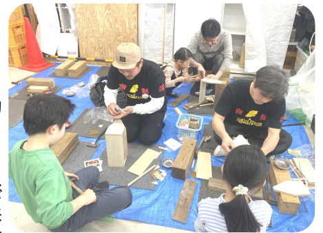
チラシを見た小学生がたくさん遊びにきました

3月1日(日)、新落合西分会では、「とりあえずやってみよう精神」をキャッチフレーズに、何事にもまず挑戦してみようという気持ちで日々活動しています。今回の住宅デーの準備会議でも、何を出店するかみんなで頭を悩ませました。しかし、「まずはやってみよう」という思いで、最終的に8項目の出店を行うことになりました。