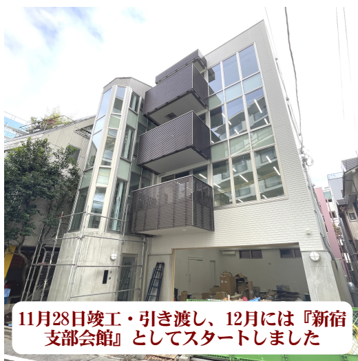
11月28日竣工・引き渡し、12月には『新宿支部会館』としてスタートしました

しかし、建築費や土地の価格の高騰により移転先物件の確保が難航し、2023年度には建て替え工事の方向に決断しました。6月に設計デザインコンペ1位の㈱ランドテック一級建築士事務所と基本設計契約を締結しました。7月には支部四役が本部労働部からの