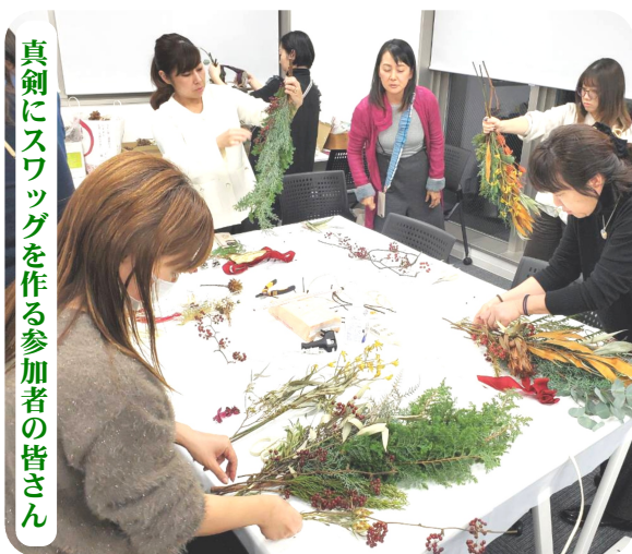
真剣にスワッグを作る参加者の皆さん