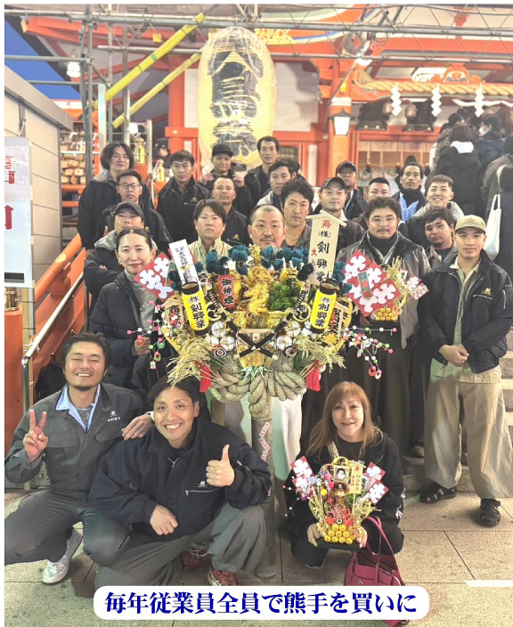
毎年従業員全員で熊手を買いに

—Q1 御社のお仕事内容の紹介をお願い致します— 仕事内容は、鷹、足場の組み立て・解体。主にゼネコンの現場で働いてる。 元々プロでボクシングをやっていたんだけど、年齢的なこともあって引退して