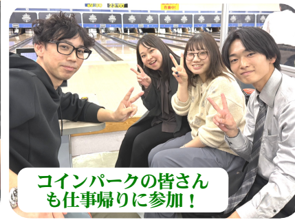
コインパークの皆さんも仕事帰りに参加！