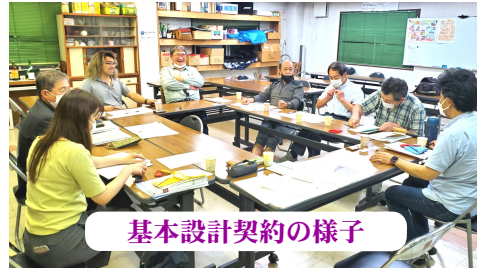
基本設計契約の様子

設計デザインコンペ投票の結果、1位のデザイン案を元に、5月31日会館建設検討委員会で議論し、6月執行委員会で開催し、6月15日(木)に(株)ランドテック一級建築士事務所との基本設計契約を締結しました。 全体の工程は、基本設計後の10月頃施工業者募集開始、年内に建築確認を申請し、来年4月21日支部