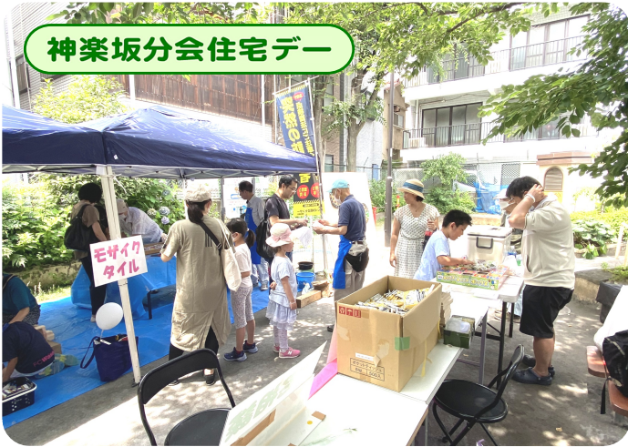
神楽坂分会住宅デー