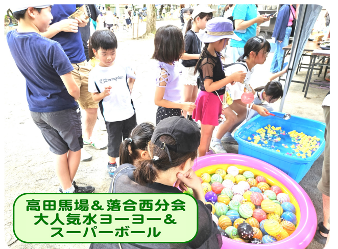
高田馬場&落合西分会 大人気水ヨーヨー& スーパーボール

会での検討した結果、参加することにになりました。現実的な問題として、参加組合員の高齢化や