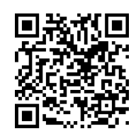
講演② + 質疑応答