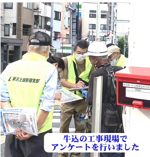
牛込の工事現場でアンケートを行いました

新宿区公契約条例では、東京都設計労務単価の90%以上が労働報酬下限額となっており、従事する全ての労働者がそれ以上の報酬を賃金を支払ってもらえることができることになっています。ところが、回収できたアンケート9枚の内、職長さん1人以外は、実際に受け取っている日給単価が、この労働報酬下限額を下回っています。 状況で、公契約条例適用現場である事を知らない人がほとんどでした。来年7月までの工期の現場なので、定期的に現場従事者の実態を聞き取り、条例の発展につなげていきます。