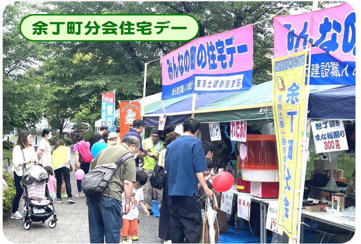
余丁町分会住宅デー