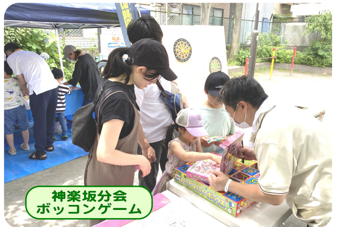
神楽坂分会 ボッコンゲーム