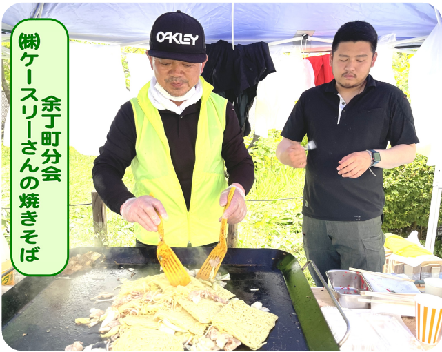
余丁町分会 ㈱ケーブリースリーさんの焼きそば