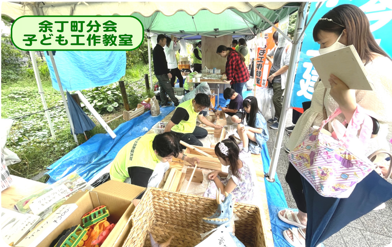
余丁町分会 子ども工作教室