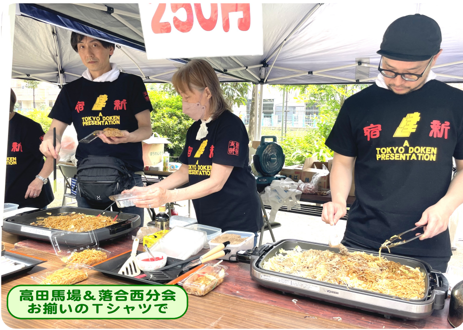
高田馬場&落合西分会 お揃いのTシャツで

2023年6月18日の日曜日。梅雨の晴れ間で気温も上がり夏模様となったこの日、高田馬場分会は他団体と合同による『落合春まつり・春の住宅デー』を落