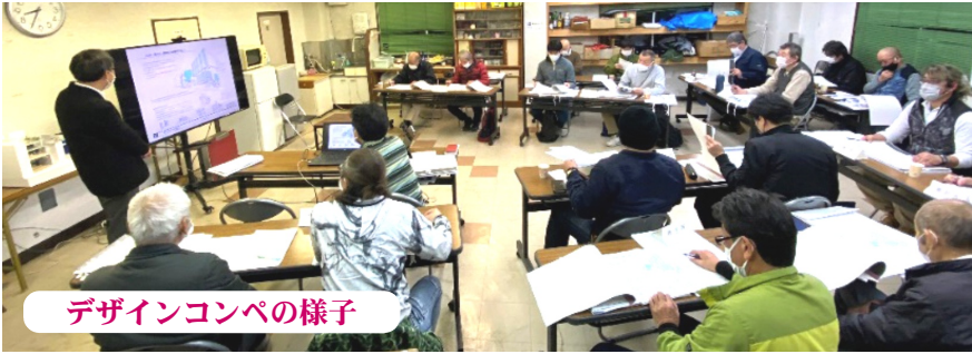
デザインコンペの様子

編集・発行人 東京土建一般労働組合新宿支部 新宿区北新宿4-33-9新建ビル 電話03(3362)2161 Fax03(3362)2289 http://www.doken-shinjuku.jp E-mail: shinjuku@tokyo-doken.or.jp 定価1部 50円