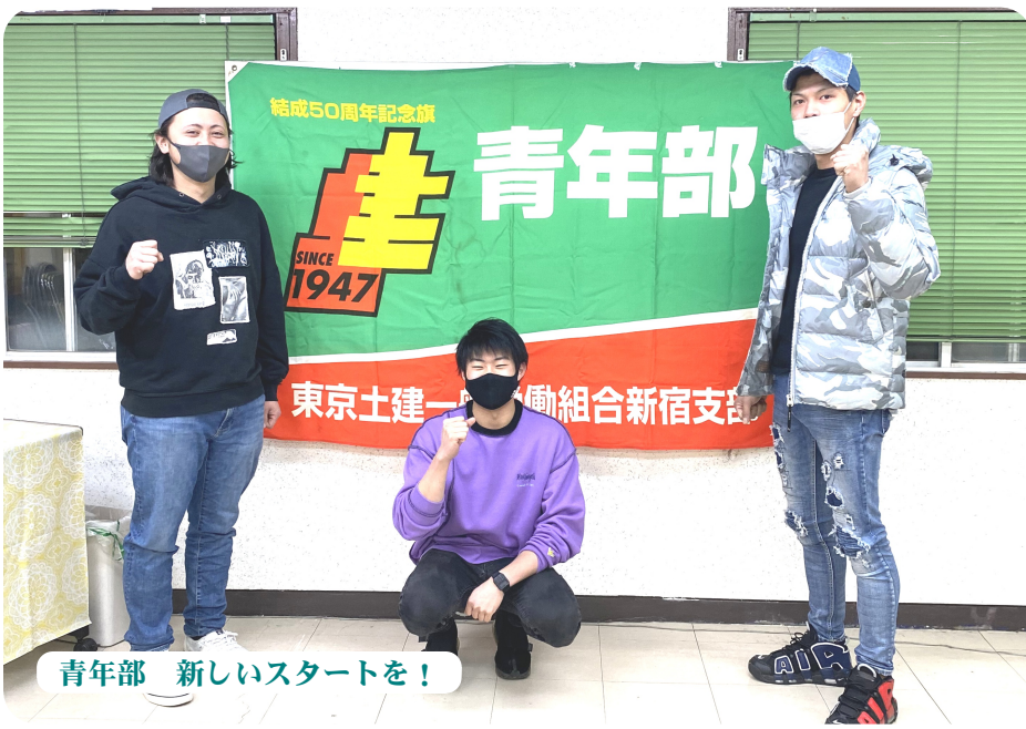
青年部 新しいスタートを!