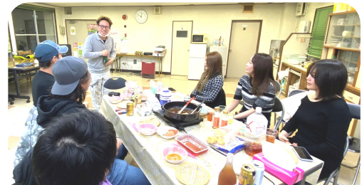
最高に楽しい時間をすごしました!