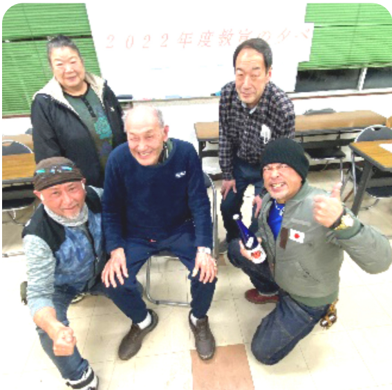
受賞者の皆さん ありがとうございました