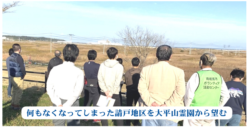
何もなくなってしまった請戸地区を大平山霊園から望む