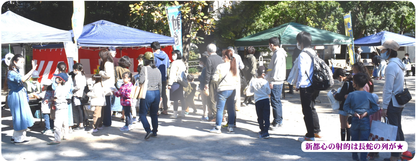
新都心の射的は長蛇の列が★