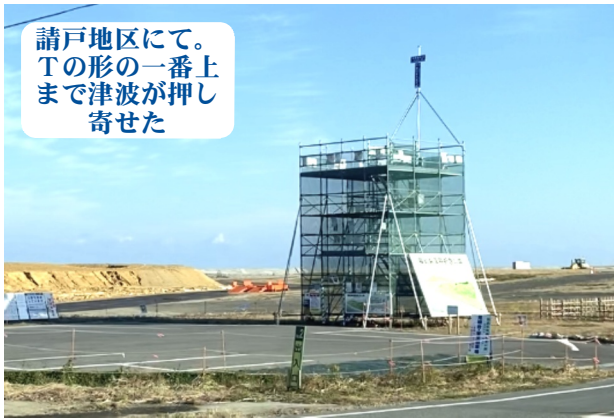
請戸地区にて。Tの形の一番上まで津波が押し寄せた