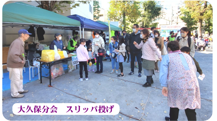
大久保分会 スリッパ投げ