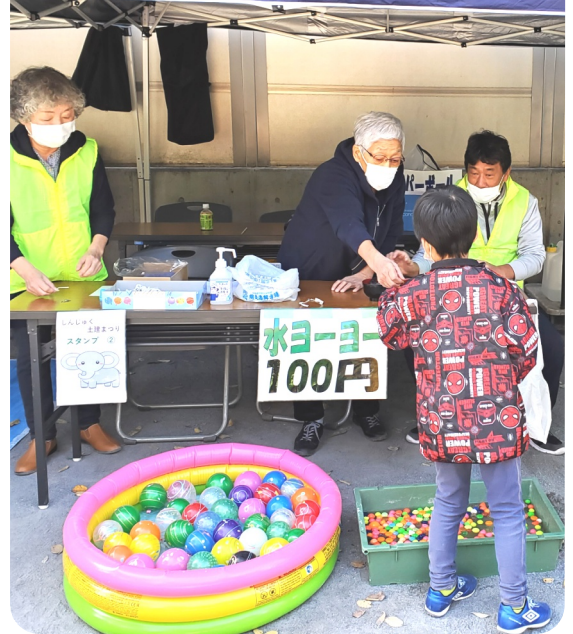
落合西分会は水ヨーヨー♪