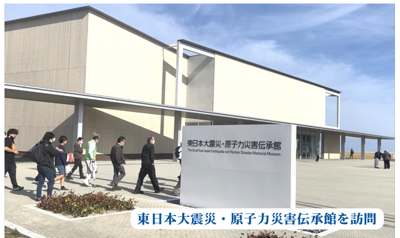
東日本大震災・原子力災害伝承館を訪問

ぶり3回目の復興支援ボランティアに参加しました。新宿からバスに揺られて5時間、最初に訪れた所は、東日本大震災・原子力災害伝承館でした。そこでは当時の東日本大震災による被害の様子、大震災による被害の様子、津波が発生し原子力発電所被害の状況、復興へのプロセス等、後世に伝えるための展示がされています。