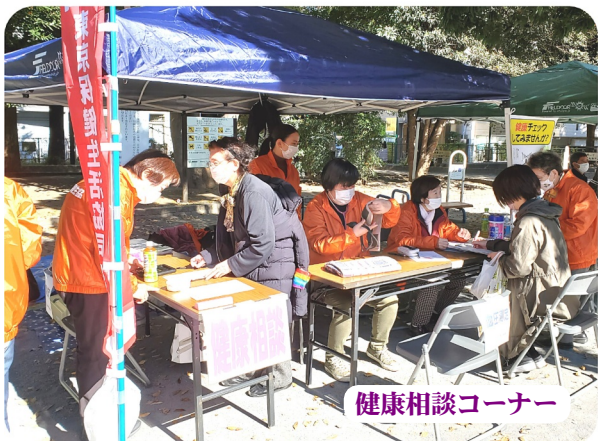
健康相談コーナー

新型コロナウイルス感染症拡大防止の観点で例年の様な、おしるこポップコーン、焼きそば等の飲食の提供が出来ない中、どれだけの方が来てくれるだろうと不安もありましたが、ふたを開けてみれば例年通りの