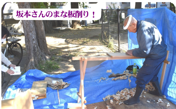
坂本さんのまな板削り!