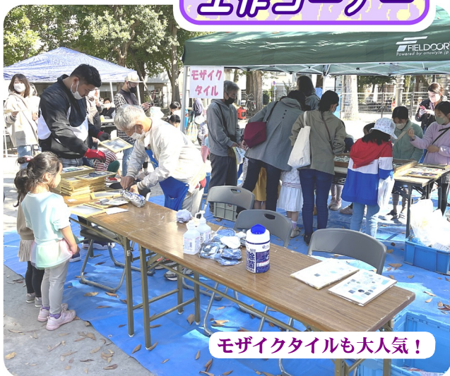
モザイクタイルも大人気!