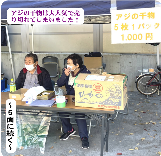
アジの干物は大人気で売り切れてしまいました!