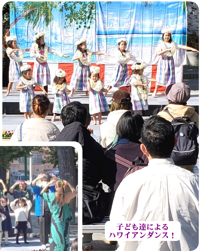
子ども達による ハワイアンダンス!