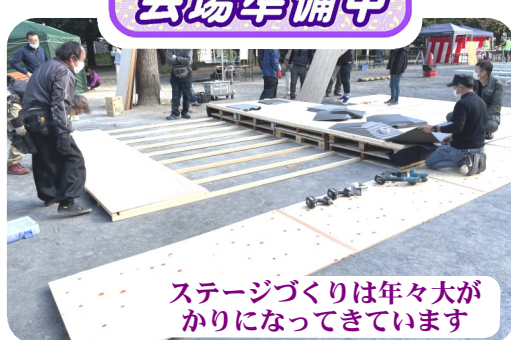
ステージづくりは年々大がかりになってきています

東京土建新宿支部は11月6日(日)、2019年に開催して以来実に3年振りに土建まつりの開催に至りました。 春から幾度となく協議を重ね、今年こそ行おうという新宿支部の思いが結実した日となりました。 2面に続く