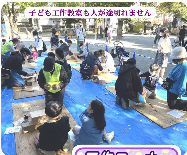
子ども工作教室も人が途切れません