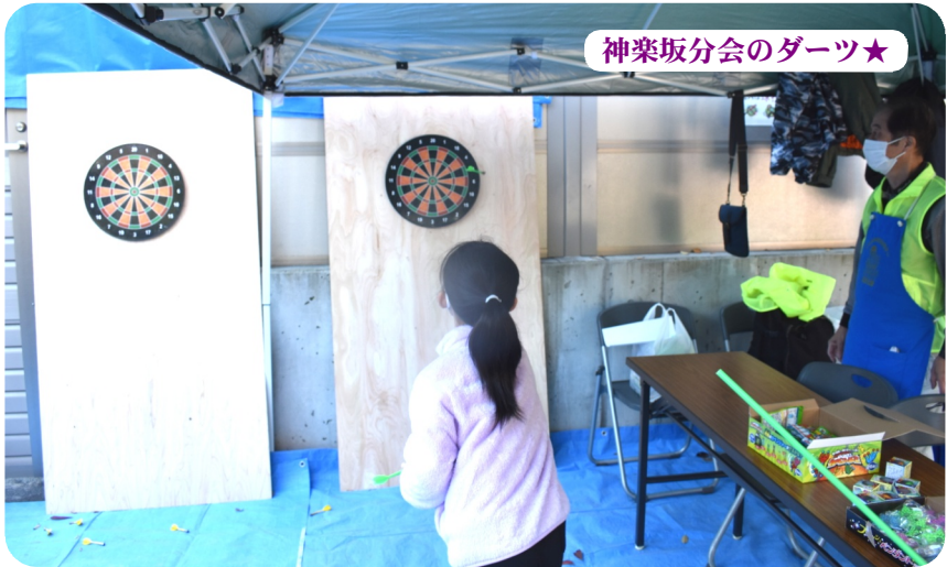
神楽坂分会のダーツ★