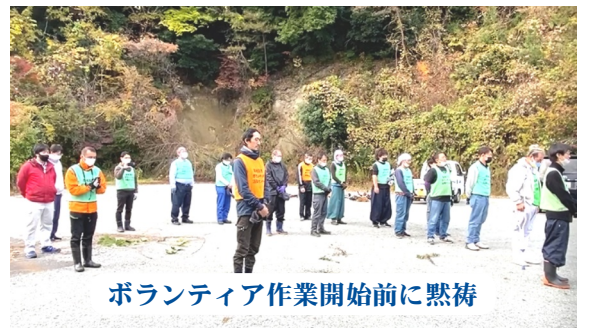
ボランティア作業開始前に黙祷

と思われ若いガイドの方の想いが伝わってくる学習となりました。その後ボランティアセンターから明日の現場下見に向かい、その日は宿へ向かいました。2日目はいよいよボランティアです。今年、震災で泣く泣く廃業した旅館跡地の草木の伐採作業を行いました。新