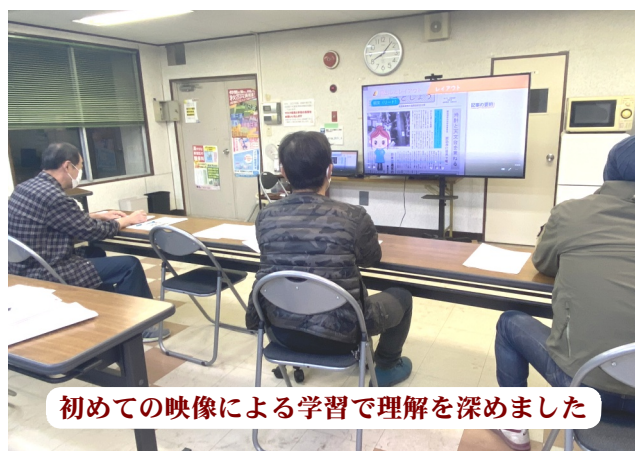
初めての映像による学習で理解を深めました

現在の機関紙しんじゆく改善点も、改めて基礎をおさらいすることで見えてきた部分もありました。今はPCで新聞のレイアウト自体は簡単にできてしまつ時代です。分会新聞を製作した分会に報價を出す案も出て、次年度以降の分会新聞の作製実現にむけて手ごたえある学習会となりました。