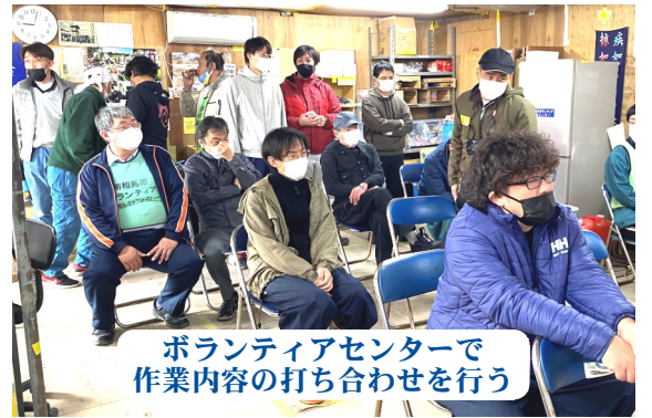
ボランティアセンターで作業内容の打ち合わせを行う

請戸小学校の生徒たちがどうやって避難したのかを目的の何もない景色を見て、その場にながら聞くことは大切な、身に染みる経験となりました。「被災地を訪れたみなさん、他人事だと思わないでほしい、明日は自分なりに分かる災難かもしれない、それを感ずて欲しい」まだ30代前後の現場下見に向かい、その