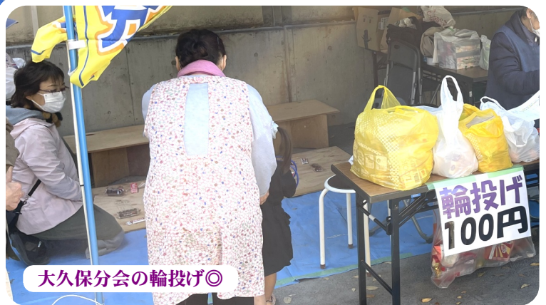
大久保分会の輪投げ◎