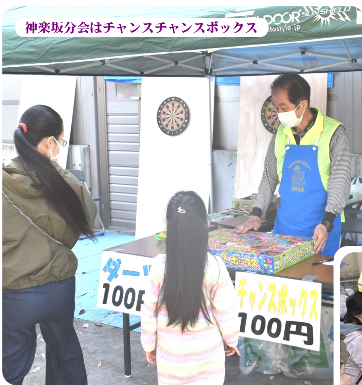
神楽坂分会はチャンスチャンスポックス