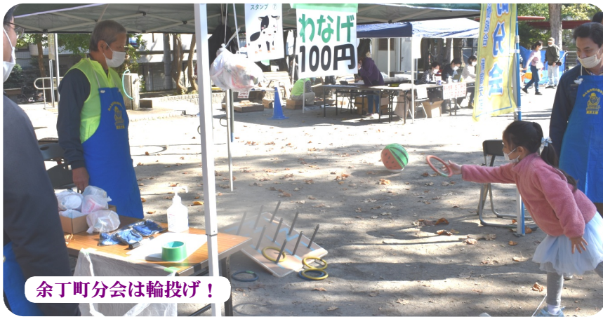
余丁町分会は輪投げ!