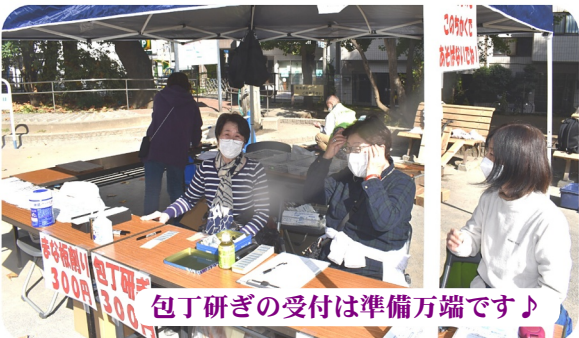
包丁研ぎの受付は準備万端です!