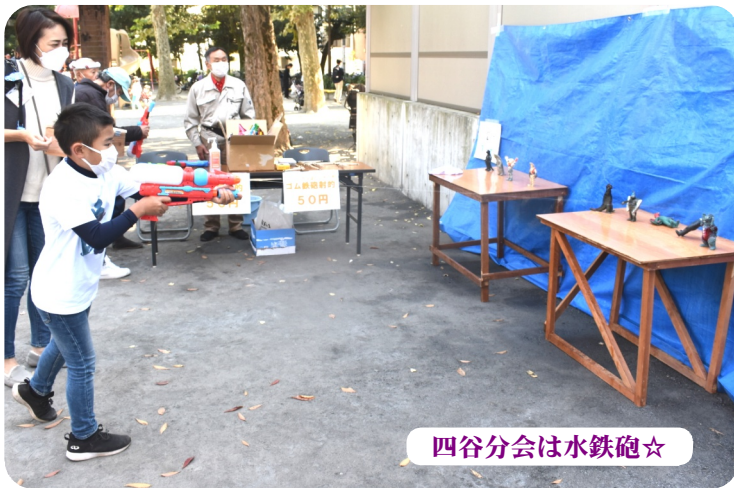
四谷分会は水鉄砲☆