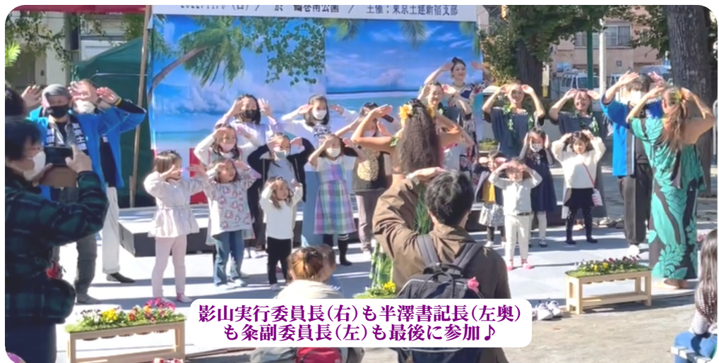
影山実行委員長(右)も半澤書記長(左奥) も衆副委員長(左)も最後に参加♪