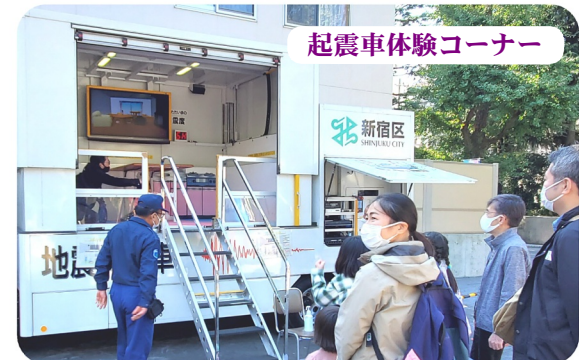
起震車体験コーナー