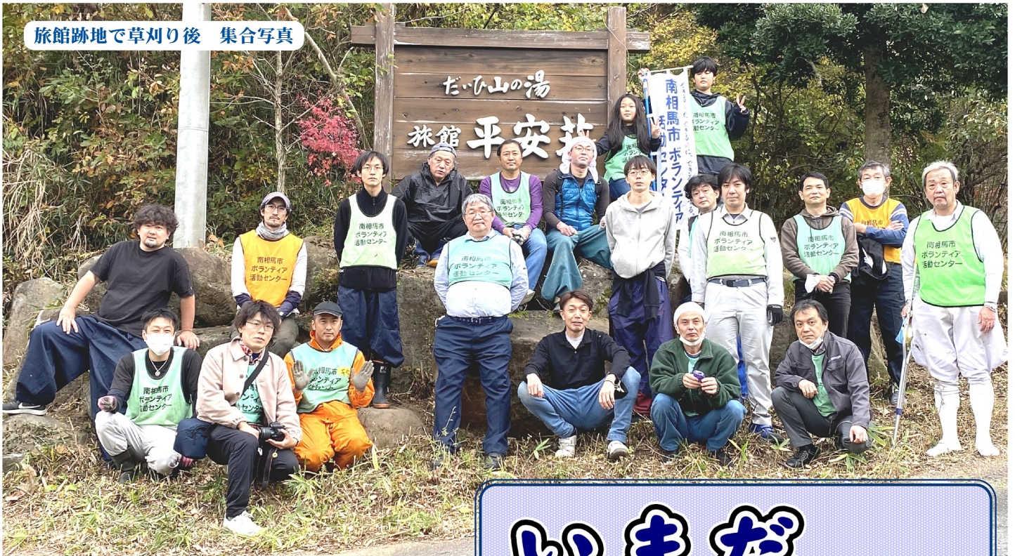
旅館跡地で草刈り後 集合写真