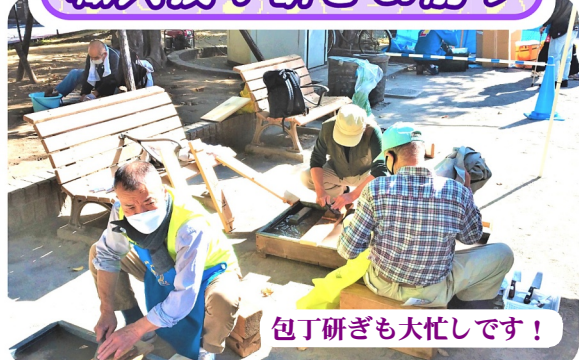
包丁研ぎも大忙しです!