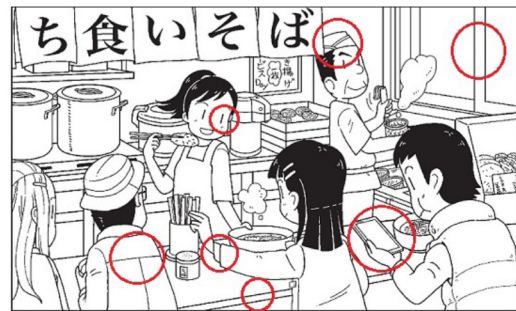
7つのマチガイ [問題]上の絵と下の絵では7つのマチガイがあります!どこでしょう?(作・野上和彦)