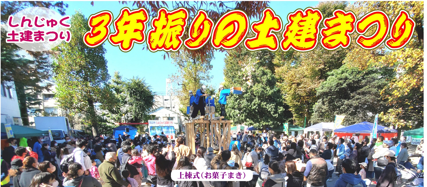
上棟式(お菓子まき)

編集・発行人 東京土建一般労働組合新宿支部 新宿区北新宿4-33-9新建ビル 電話03(3362)2161 Fax03(3362)2289 http://www.doken-shinjuku.jp E-mail: shinjuku@tokyo-doken.or.jp 定価1部 50円