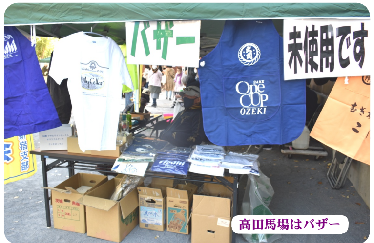
高田馬場はバザー