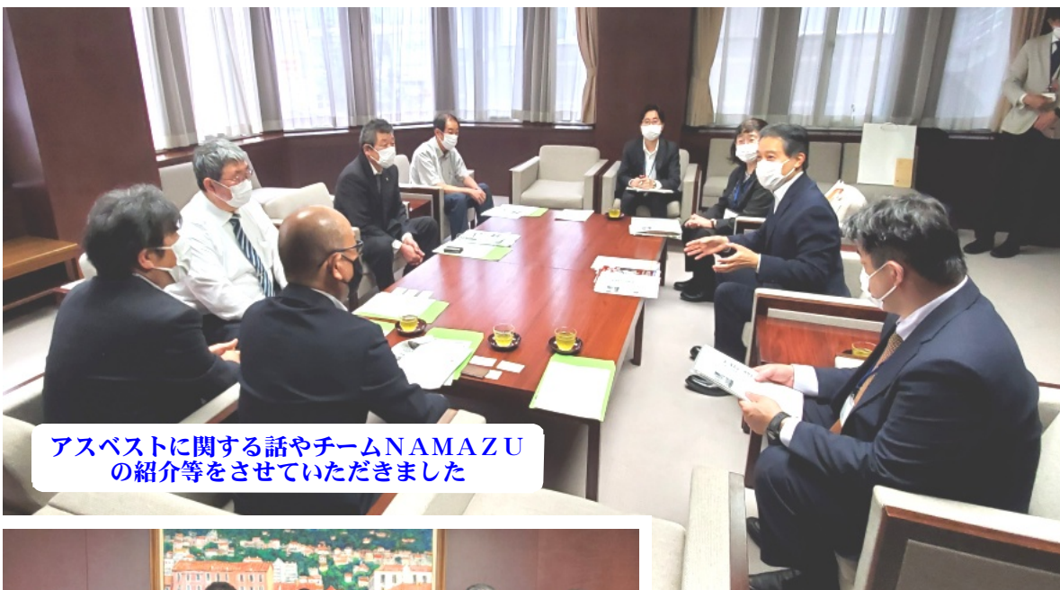
アスベストに関する話やチームNAMAZUの紹介等をさせていただきました