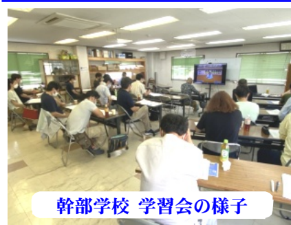
幹部学校 学習会の様子

余丁町分会は6月12日 (日)、支部で先陣をきつ て、分会住宅デーを を行いました。梅雨入 りで心配された雨も なく実施することが 出来ました。