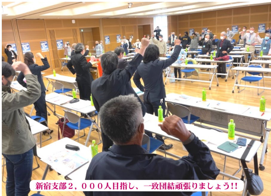
新宿支部2,000人目指し、一致団結頑張りました!!