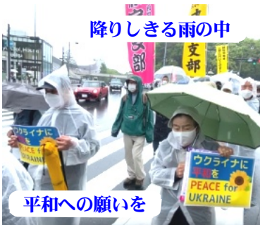
降りしきる雨の中

第93回メーデーはコロナ禍の為、規模縮小ではありますが、今年度はようやく配信メインではない開催となりました。5月1日(日)代々木公園で開催された中央メーデーに2,900人が集まり、東京支部からは680人、新宿支部からは24人が参加しました。 今年度は密を避ける為、デコレーション制作はせず、デモ行進のみ、さらに数年ぶりのあいにくの雨の中という状況でしたが、参加した皆の足取りはしっかりと元氣よく前へと向かいました。侵略戦争を止め、憲法9条改憲を阻止し、憲法を真に活かした社会を実現させ、労働者の権利が守られた、豊かな社会の実現を要求として、「ロシアはウクライナから撤退させよう」「憲法9条を守ろう」「憲法を守り活かす社会をつくらう！」「労働法制の大改悪反対」など、代々木公園から表参道へ向かう青山コースをシュプレヒコールをしながら行