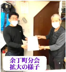
余丁町分会拡大の様子