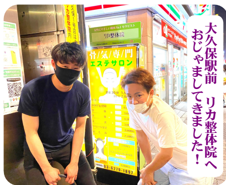
大久保駅前 リカ整体院へおじゃましてきました！

た判決は確定したものの、違法期間が限定された事や、屋外作業者は認めない等、差戻しとなり、気持ちの悪い五月晴れとはなりません。国が国内に持ち込み建材メーカーが取り扱い、アスベストの危険性を周知せず国内に蔓延させたので、被害者は救済され当然です。しっかりとしたアスベスト補償基金制度を創設するまで闘い、さら