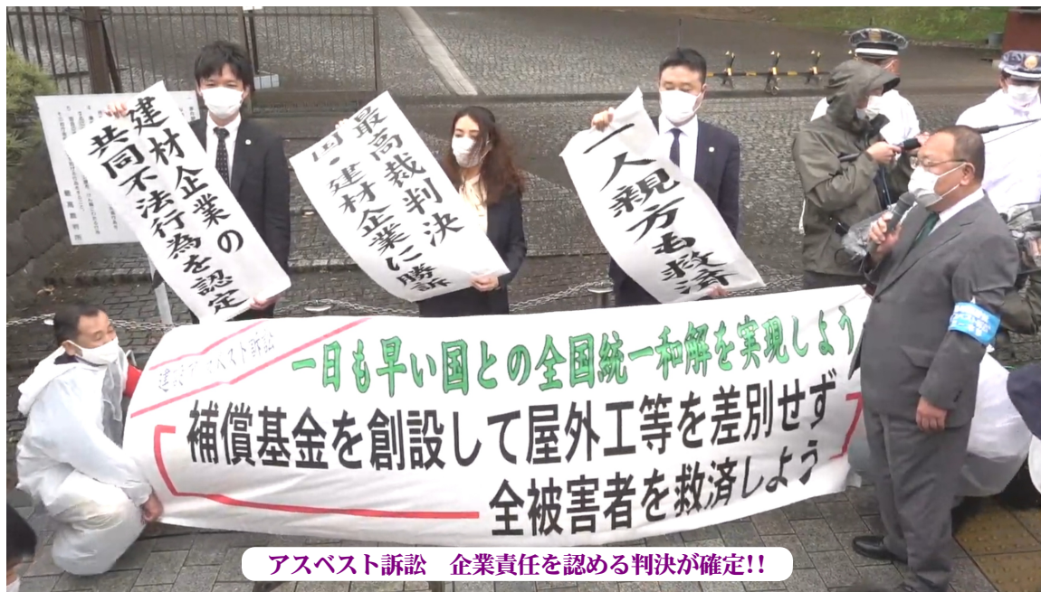
アスベスト訴訟 企業責任を認める判決が確定!!