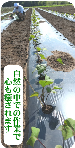
自然の中での作業で 心も癒されます

今、栽培している野菜は、ジャガイモ、里芋、トマト、茄子、枝豆、大根、トウモロコシ、ス