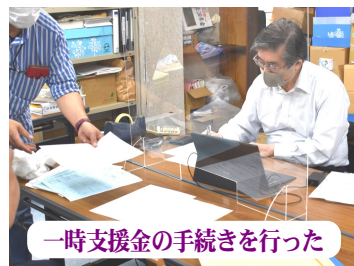
一時支援金の手続きを行った

コロナ禍の中、経営難に対し補償を求める声が相次ぎ、「一時支援金」が創設され3月8日から申請を受け付け