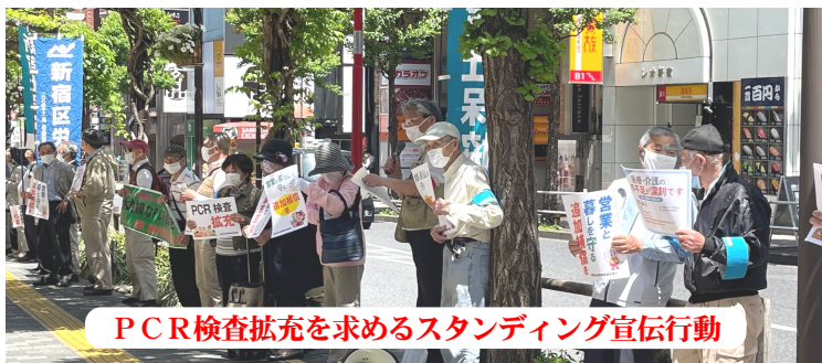
PCR検査拡充を求めるスタンディング宣伝行動

東京都は4月9日にコロナ対策として2,576億円の補正予算を計上しました。内訳としては営業時間短縮による協力の支給が2,379億円と大半を占めますが、感染者が確認された場合クラスター化等が懸念される集団に対し、感染者の早期探知により感染拡大を早期に防止するため、集中的・定期的にPCR検査を実施する予算として戦略的検査強化事業に10億円を計上しています。東京土建新宿支部も参加する新宿社保協では、感染者が確認され