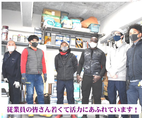
従業員の皆さん若くて活力にあふれています!