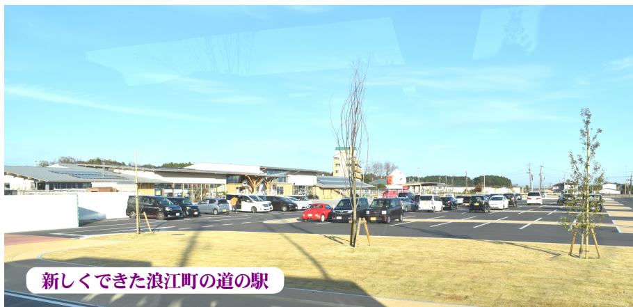
新しくできた浪江町の道の駅

自身4度目の福島南相馬市の復興支援。まず昨年までと大きく違ったところと言えば何と云っても天気です。今までは時期が悪く台風を追うように向かうとか直撃だとか悪天候の中のボランティア活動でした。今回のボランティアは快晴！こんな天気の時はずいぶんグにでも行きたくありません。