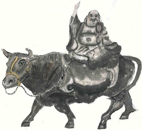
【新都心分会 早川 義栄】