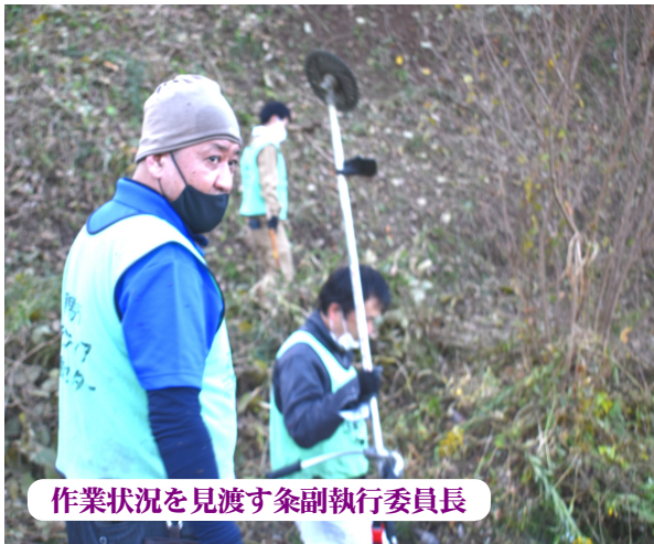
作業状況を見渡す糸副執行委員長

東京土建新宿支部は2020年で10年目となる杉並支部との合同復興支援に参加してきました。新宿支部は参加して4年目となります。12月号に続き参加者の報告を掲載します。