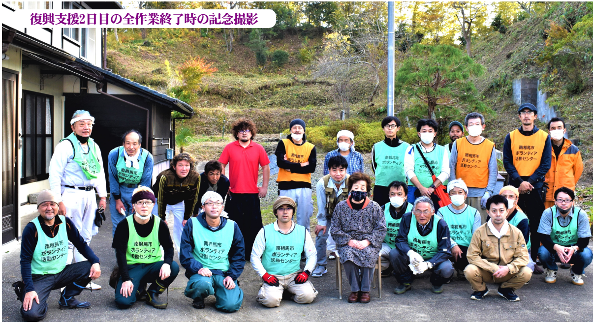
復興支援2日目の全作業終了時の記念撮影