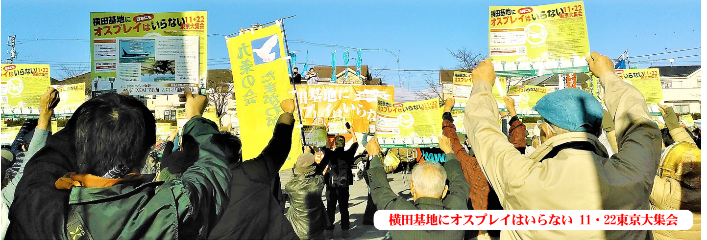
横田基地にオスプレイはいらぬ 11・22東京大集会