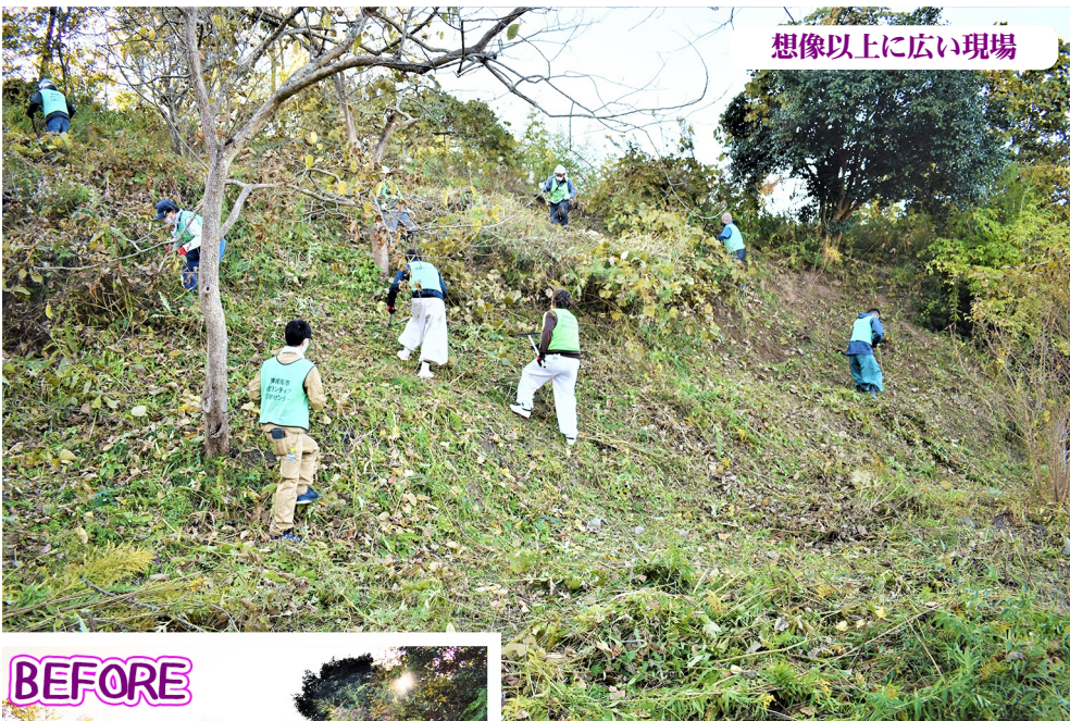
想像以上に広い現場