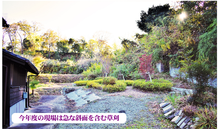
今年度の現場は急な斜面を含む草刈

―1面続き― 私には全く縁の無いGO・TO関連かと思っていたが、GO・TOを使った旅行とすることで(※ファミレスで地域共通クーポン券を使いました)、それだけでも重要な経験だ。