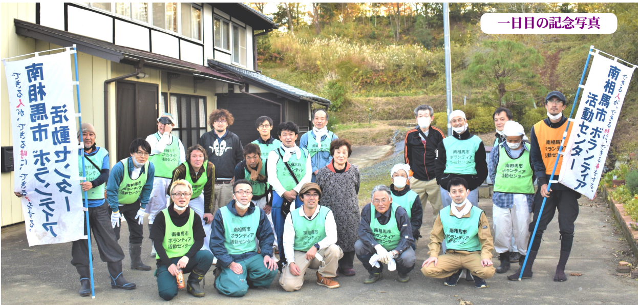
一日目の記念写真

東京土建新宿支部は今年10年目となる杉並支部との合同復興支援に参加してきました。新宿支部は参加して4年目となります。以下、参加者の報告を2号に渡り掲載します。