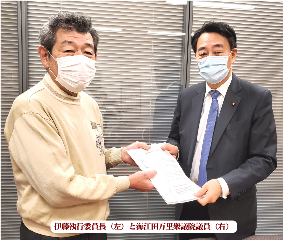
伊藤執行委員長（左）と海江田万里衆議院議員（右）

建設国保及び建設アスベスト基金制度創設への理解があり、基金制度創設の新しいパンフレットをお渡しし改めて概略を説明。法制局長官や立憲民主党の議員連盟にも話しをすると、積極的な協力のご意見がありました。