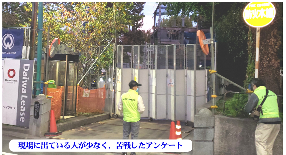
現場に出ている人が少なく、苦戦したアンケート

11月22日(日)東京・首都圏の空は、「オスプレイ銀座」と呼ばれるほど、米軍・陸上自衛隊のオスプレイが整備や訓練を行っています。集会中、休日にも関わらず会場上空を米軍の輸送機が飛行。横田基地周辺は常に危険と隣り合わせです。若者からこれまでの取り組みや今後の決意などが述べられ、日本にオスプレイはいらぬ等の今後の取り組みが提起されました。全体で1000人、東京土建から25支部227人、支部から5人が参加。参加者から「参加数はコロナのせいでさすがにやや少なくデモ行進も中止になってしまったが、オスプレイはいらぬと元気にシュプレヒコールをあげてきた」との声がありました。