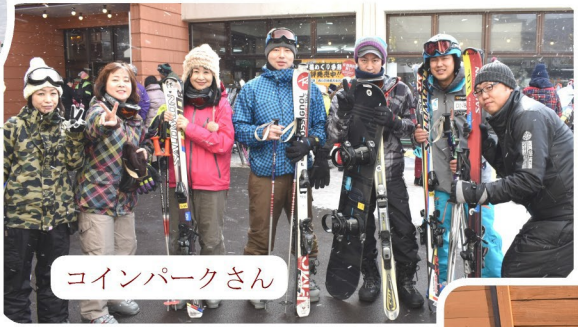
コインパークさん

ご飯も美味しかったです。また、湯もみや太鼓を体験することも出来る。有意義に過ごすことが出来ました。2日間、のんびりとスキーをすることができましたが、スキーだけではなく、子ども向けの宝探しやチューブに乗って滑ることも出来、2日間雪遊びをたっぷり楽しむことが出来ました。また参加したい!!またこのイベントをしてほしい!!というのが率直な気持ちです。楽しかった!