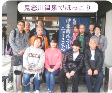
鬼怒川温泉でほっこり

●まちがい箇所を丸印で示し、支部まで送ってください。はがき・ファクス・メールで。分会・住所・氏名を(家族の方は組合員の氏名も)書いて下さい。余白には新聞の感想や身近なできごとを「必ず」添えてください。 (未記載は抽選対象外) ●宛先： 〒169-0074 新宿区北新宿 4-33-9 東京土建新宿支部 ●正解者の中から10名に抽選で図書カードをプレゼント。 ●〆切：3月25日(月)