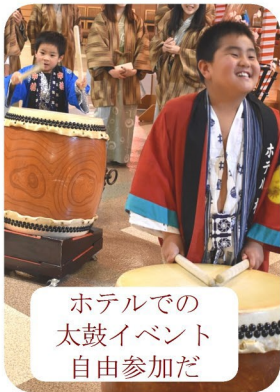
ホテルでの太鼓イベント自由参加だ

会社の同僚と草津のスキーアに参加しました。スキーなんて二十数年滑っていないので温泉で雪見酒のつもりでしたが、一度滑ってみたら面白すぎて集合時間ギリギリまで楽しんでしまいました。宿泊したホテ