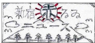
神楽坂分会の皆さん