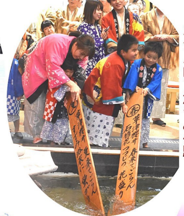
ホテル内で湯もみ体験！