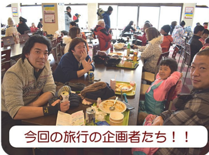
今回の旅行の企画者たち！！