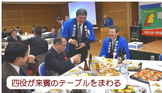
四役が来賓のテーブルをまわる

あったので楽しみに行きました。料理も美味しく、見事に抽選にも当たり北海道産のウインターセットをいただきました。健康に気を付けて今年も頑張ります。