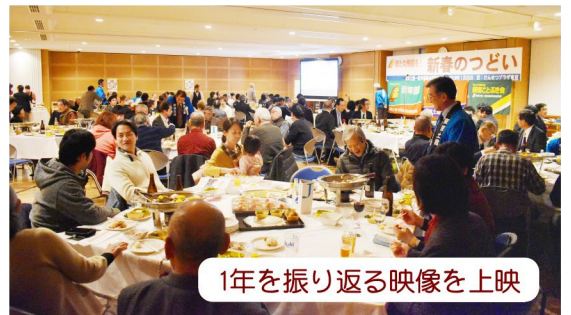
1年を振り返る映像を上映