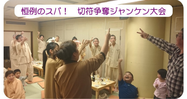
恒例のスパ！切符争奪ジャンケン大会