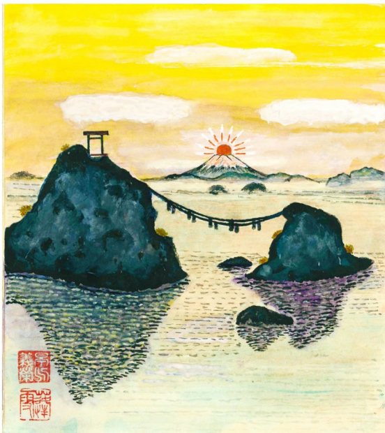
伊勢志摩夫婦岩から望む富士山の日の出

ありました。今年も行いたいと思しますので、是非大勢の組合員・家族の参加とご協力をお願いいたします。 一方、平和の問題では改憲の恐れは依然として解消されておらず、沖縄新基地建设は強行され、横田基地へオスプレイが常時配備され東京の空を飛びまわり、基地問題は私たち日本国民全体の問題です。森・加計問題は、うやむやにされる一方で、消費税もいよいよ値上げされる方向です。社会保障の充実や、法定福利費の請求確保も、適正とはほど遠い状況で、外国人受け入れ問題の入管法が強行採決され、人災である労災事故も多発しています。 今こそ組合が大きな力を発揮しなければならぬ時だと思えます。我々の地位向上、賃金アップ、完全週休2日を目指し、後継者を育てていきましょう。 新宿区では、いよいよ念願の公契約条例が制定される動きがあります。実効性ある条例になる様、努めて参ります。仲間の皆様とご家族のご健勝ご多幸をお祈りいたします。 様々な運動の発展にご協力賜りますよう本年もよろしくお願ひします。