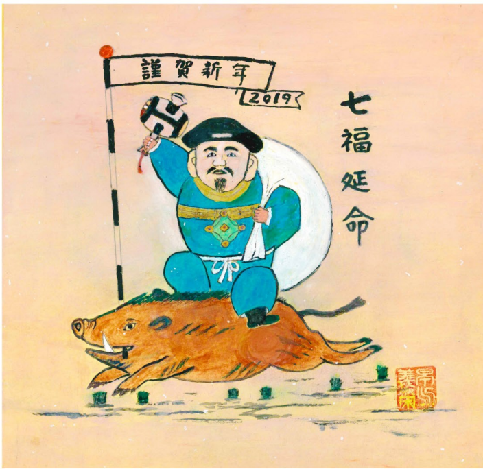
大黒様と今年の干支の亥