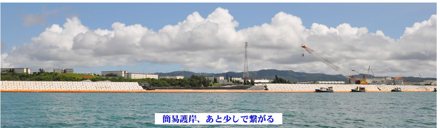
簡易護岸、あと少しで繋がる