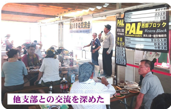
他支部との交流を深めた

7月15日(日)西部ブロックPALの会のイベント「としまえんBBQ交流会」に参加しました。全体で150人、新宿支部からは12人の参加でした。今年5人の初参加者があり、PALの会の会員拡大にも繋がりました。参加者は朝からプール・アトラクション等自由に過ごしていただき、お昼に集