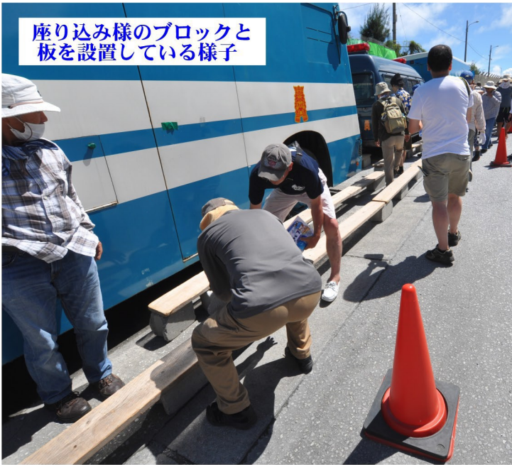
座り込み様のブロックと板を設置している様子