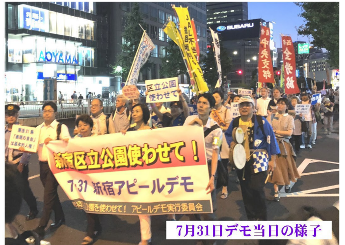
7月31日デモ当日の様子

7月31日(火)「新宿区立公園使わせて! 7・31アピールデモ」が、今回のデモ規制の適用は区議会を通して決定されたものではなく、区長と職員による決済のみで強行されたものです。記事掲載後、区議会は7月24日に自民党、公明党を除く立憲民主党、共産党等5会派の議員15人が統一して意見書を区長へ提出し、デモ規制の撤回を求めました。また同日夜、高田馬場のリサイクル活動センターにおいて「新宿区のデモ規制と表現・集会の自由を考えるシンポジウム」を開催