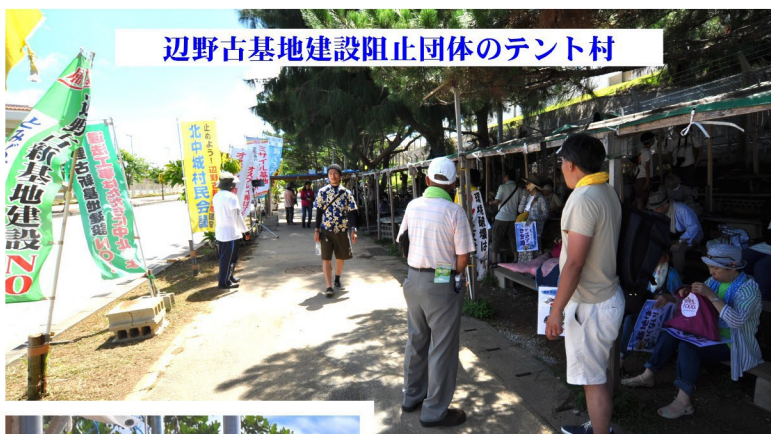
辺野古基地建設阻止団体のテント村