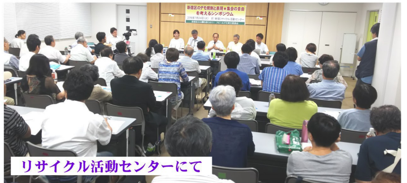
リサイクル活動センターにて

7月15日(日)西部ブロックPALの会のイベント「としまえんBBQ交流会」に参加しました。全体で150人、新宿支部からは12人の参加でした。今年5人の初参加者があり、PALの会の会員拡大にも繋がりました。参加者は朝からプール・アトラクション等自由に過ごしていただき、お昼に集