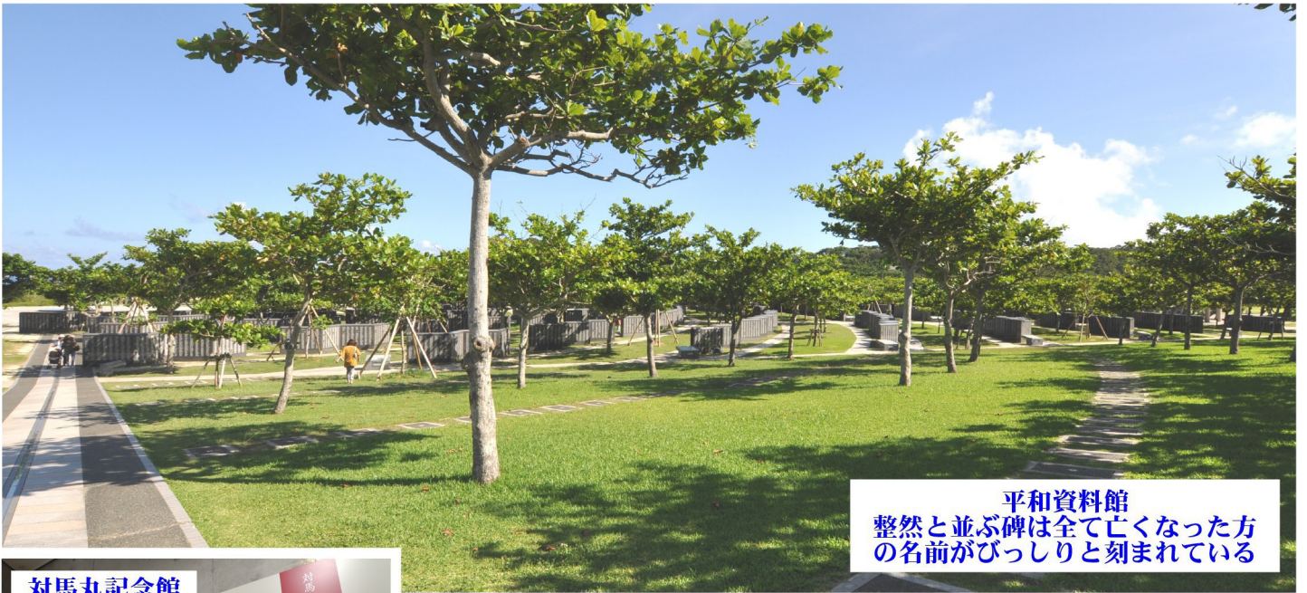
平和資料館 整然と並ぶ碑は全て亡くなった方 の名前がびっしりと刻まれている