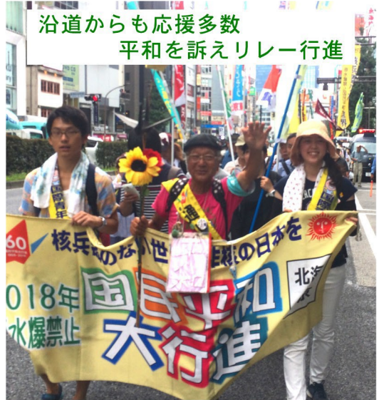
沿道からも応援多数 平和を訴えリレー行進

たった一人から始まった平和を祈る行進、原水爆禁止国民平和行進も今年で60年目の節目を迎えました。7月26日(金)猛暑が奇跡的に和らぎ、新宿区役所には今年も多くの平和行進参加者が詰めかけました。新宿支部からは13人が参加。上野公園