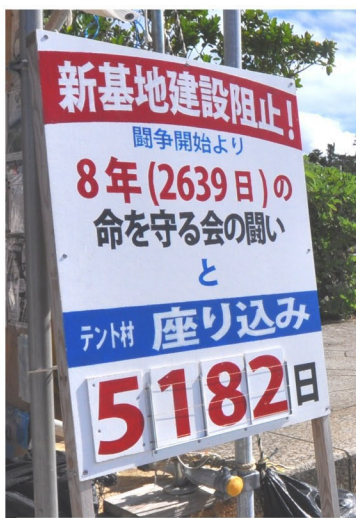
テントにあった座り込み開始から5182日