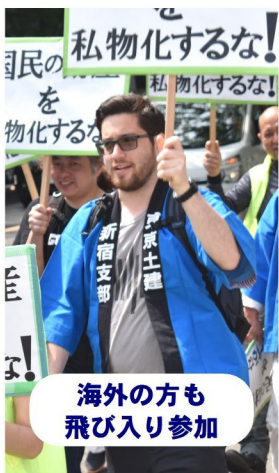
海外の方も飛び入り参加

をWで受賞しましたので、それを一つの区切りとして今年度からはまた新しい試みとして「全世代で取り組む」メーデーに挑戦しました。賞は取れなかったも