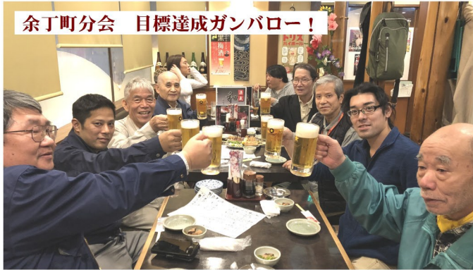
余丁町分会 目標達成ガンパロー!