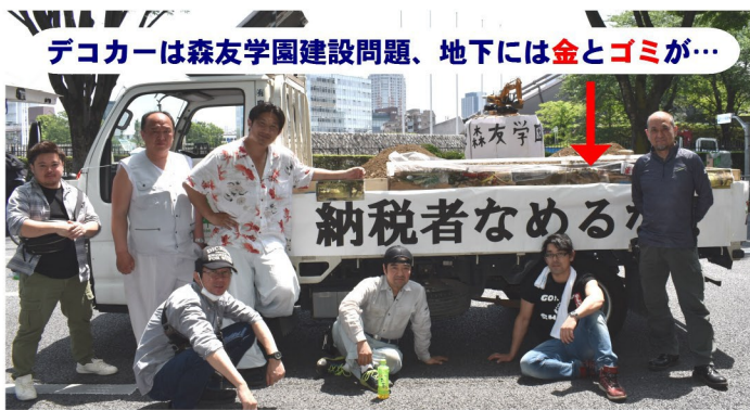
デコカーは森友学園建設問題、地下には金とゴミが...

5月1日(火)に第89回メーデーが全国307ヶ所で開催され、東京土建新宿支部も代々木公園で開催された中央メーデーに参加しました。土建からは2、184人、新宿支部からは45人の参加がありました。