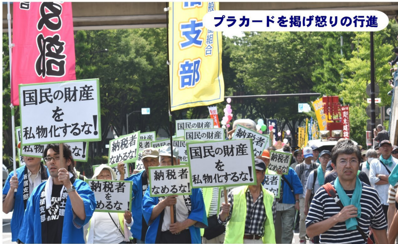
プラカードを掲げ怒りの行進