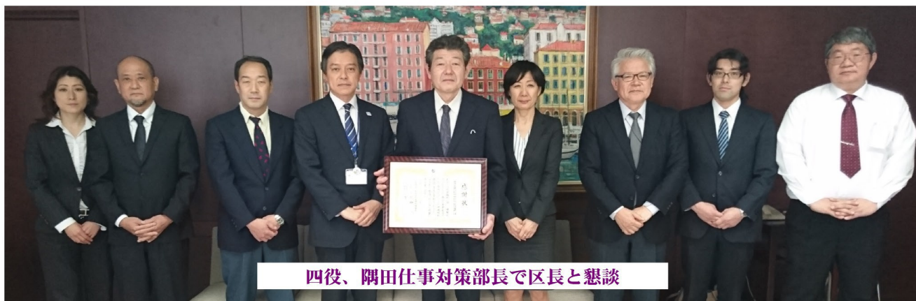
四役、隅田仕事対策部長で区長と懇談