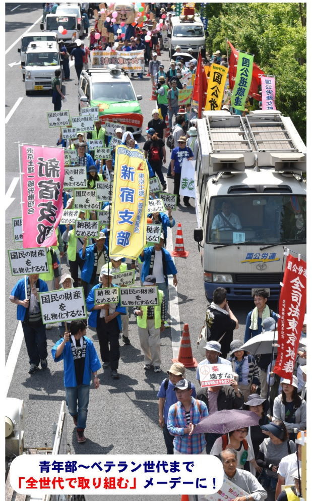
青年部～ベテラン世代まで「全世代で取り組む」メーデーに!