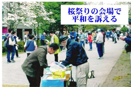
桜祭りの会場で平和を訴える

「憲法9条を守る3,000万人署名を」みんなの新宿をつくる会では春の桜まつりで賑わう4月8日(日)、署名活