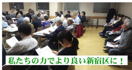
私たちの力でより良い新宿区に!