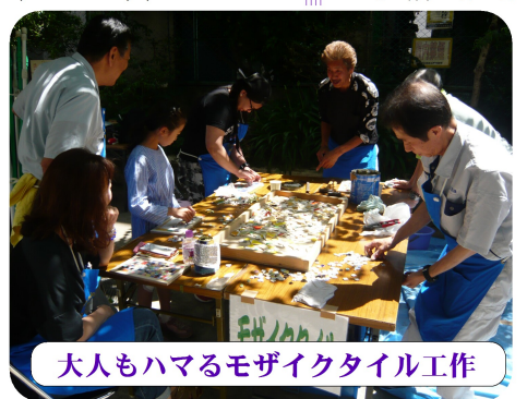
大人もハマるモザイクタイトル工作

足りなさを感じました。それでも参加者の皆さんが一致団結し、和気あいあいとした楽しい一日を過ごしました。