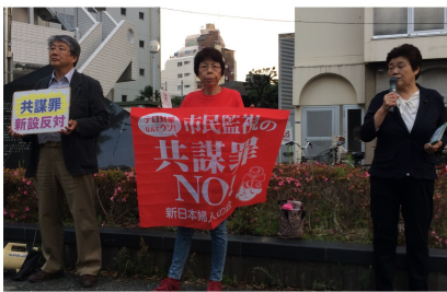
共謀罪反対を訴える

トをお配りすることが出来ました。共謀罪法案が翌15日未明に成立する、まさに直前の状況下での行動の中、通りがかりの多くの方々から「頑張って!」という言葉