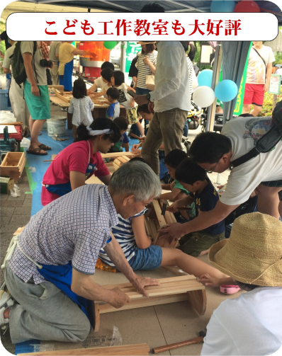
子ども工作教室も大好評