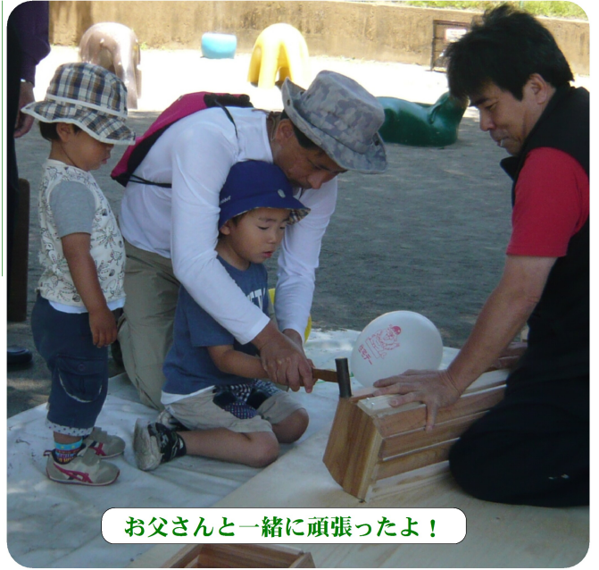
お父さんと一緒に頑張ったよ!

会場が広い公園なので、親子連れが多く、甘い白玉ぜんざいや、こども工作教室は評判で、両方共14時半の閉場前に完売になりました。そして住宅相談も3件あり、まずまずの成果でした。包丁研ぎとまな板削りは例年より少なめでした。これは会場が目立たなかったせいでしょう。