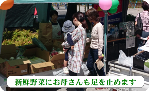
新鮮野菜にお母さんも足を止めます