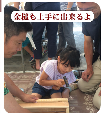
金槌も上手に出来るよ

良かった点は、人が集まれば集まるほど大変ですが、会場全体が活気に溢れ良かったです。反省点は白セメントが古くて使いにくかった事です。次回からは新しいものを使いましょう。組合員の参加者もあと数人必要でした。全体としてよかったです。来年もう一度この場所で開催したいと思います。