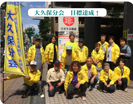
大久保分会 目標達成!