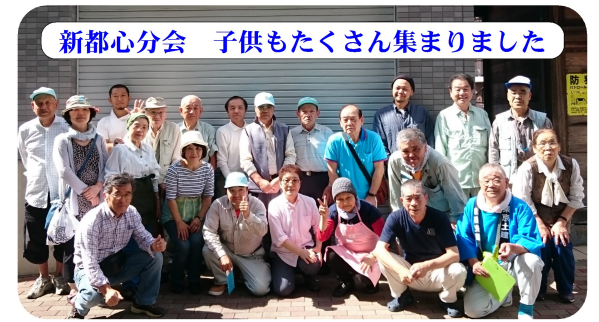
新都心分会 子供もたくさん集まりました

最後に受講された18人の参加者に修了証を渡して、足場特別教育講習は無事完了しました。