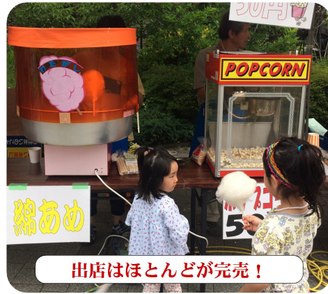
出店はほとんどが完売!

予定では雨とのことでしたが晴天に恵まれ、8時30分より会場の設営に入りました。10時になり、実行委員、分会長の挨拶がありました。