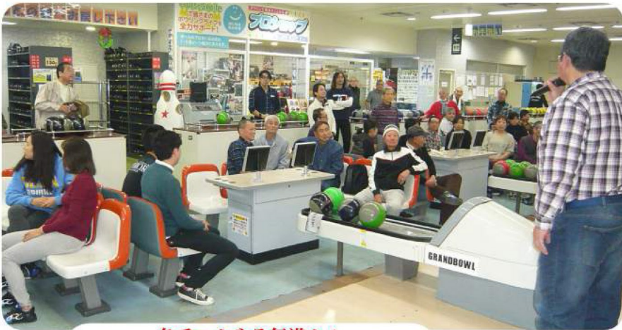
各チームやる気満々!