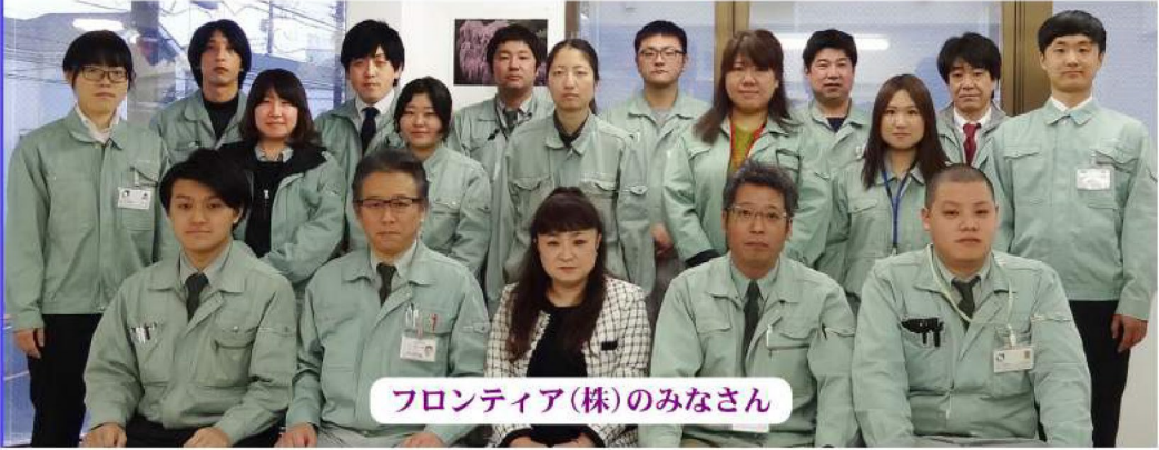
フロンティア(株)のみなさん

—Q5 建設業界全体や、もしくは御社にとって、直面している課題は何だと考えますか？ やはり人ですね。特に建設業界の人材不足で常に職人さんは募集していますが、