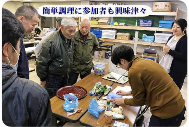
簡単調理に参加者も興味津々