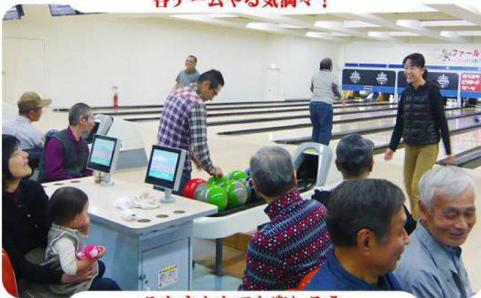
みなさんととても楽しそう