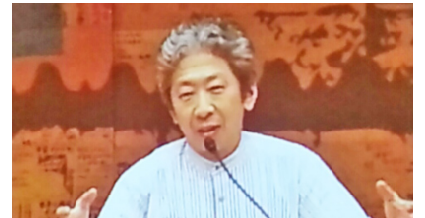
小森教授はユーモアたっぷりに講義